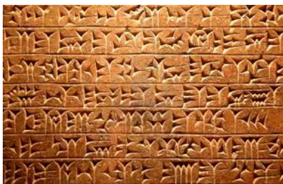
Die Keilschrift der Sumerer - eine Buchstabenschrift

Eigentlich waren die Hieroglyphen noch keine Buchstaben, sondern Bildchen, fast eine Art Comics . Dazu muss man wissen, dass die Ägypter damals für den Bau der Pyramiden vor allem Fremdarbeiter beschäftigten, die kein Altägyptisch verstanden. Bildergeschichten aber sind in allen Sprachen lesbar . Die Zeichnung eines Ochsenkopfes zum Beispiel war für jeden leicht verständlich. Nun sprachen viele der Immigranten semitisch. Sie wollten ihre Sprache schriftlich festhalten. Da Ochsenkopf auf Semitisch Aleph hieß, kamen sie überein, für den Laut A einen Ochsenkopf zu malen.